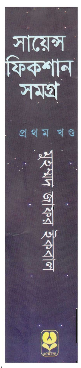
দুনিয়ার পাঠক এক হও! ~ www.amarboi.com ~